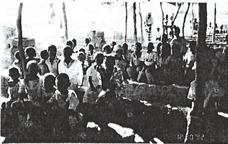
UNE ÉCOLE EN AFRIQUE

resté six ans comme responsable de cette école normale. Puis on m'a demandé d'intervenir à nouveau à OUAGADOUGOU, où j'ai pris la direction d'un collège "long" - jusqu'au bac. Et là j'ai introduit un événement qui ne m'a pas toujours fait bien