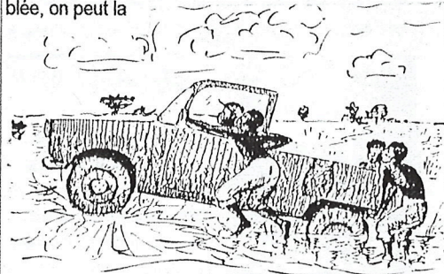
Avec une 2 CV, c'est plus facile !

pos de l'animisme : c'est un peu la façon primitive qu'à l'homme, où qu'il soit sur toute la terre, d'avoir comme l'instinct d'un ailleurs et d'un au-delà. C'est en eux quasi naturellement, sans aucune référence religieuse, pour ces gens qui sont au fond de la brousse : ils souffrent, ils meurent, ils ne savent pas pourquoi, et de ce fait il y a une réflexion, une pensée, des traditions qui leur font croire qu'au delà de la mort, il n'y a pas la mort.. Ils croient à l'immortalité, ils ont l'instinct profond de la présence divine dans l'être humain. Même ceux qui n'ont jamais entendu parler de Création, d'Évangile : ils sentent et situent les ancêtres, leurs parents, leurs amis, dans une forêt, une grosse montagne, dans les grands événements ; ce sont les ancêtres qui sont là, qui agissent et qui échangent. Notre "Communion des Saints" est une copie de l'animisme ! - Je ne vous choque pas j'espère ! - C'est extraordinaire comme profondeur, donc intéressant pour nous qui portons cette notion de Communion des Saints, de nous appuyer sur cette foi, et non pas de la contrarier comme si c'était une chose perverse. Nous avons sur le terrain, comme chrétiens porteurs d'Évangile, une rencontre avec une humanité qui est prête à recevoir. Au Niger, je me suis occupé de cet immense pays ; j'avais une petite 2 CV pour circuler, aller dans les écoles : l'unité de distance étant à peu près de 300 Kms, ce n'était pas toujours drôle ! Heureusement, quand la 2 CV est ensablée, on peut la