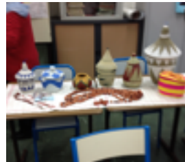
SUDOK'AFÉ N° 25 (sol.)