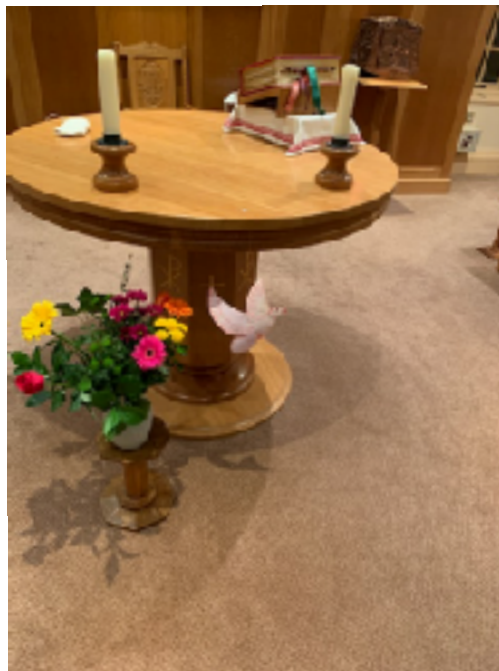
Dimanche Mondial de la Paix" - Chapelle à Apley Grange -

Je pense aux chrétiens du Tchad. Je sais que le christianisme y est arrivé vers 1920 grâce d'abord aux missionnaires protestants, avant l'influence catholique. Au cours d'arabe nous