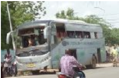
Un bus avec des vitres cassées

LES ÉTUDIANTS MÉCONTENTES ! Après 8 ans de mise en service de 37 bus pour le transport de quelques 10.000 étudiants fréquentant les 3 principaux sites universitaires de N'Djaména, une vingtaine sont encore "opérationnels" mais très délabrés : vitres cassées, sièges en lambeaux, portes automatiques qui s'ouvrent difficilement... Cette situation est de plus en plus mal vécue, déclenchant trop souvent des bagarres entre étudiants.. Certains sont obligés de faire des heures de "marche à pied".