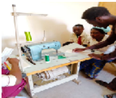
Nouvelle machine à broder

A signaler que le professeur de broderie est un de nos anciens étudiants au CCC ( Centre Cornelia Connelly ), très enthousiaste de revenir à son "Alma Mater" pour partager ses connaissances.