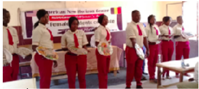
Étudiantes en restauration-Hôtellerie

Nous proposons des cours de restauration, hôtellerie et "Events Management" aux étudiants en cuisine. Ceci s'ajoute à la pâtisserie et à l'économat. Ainsi, elles pourraient même devenir hôtesses de l'air !